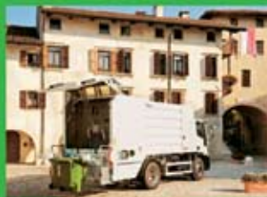
МОЙЩИКИ КОНТЕЙНЕРОВ С ЗАДНИМ И БОКОВЫМ ЗАХВАТОМ