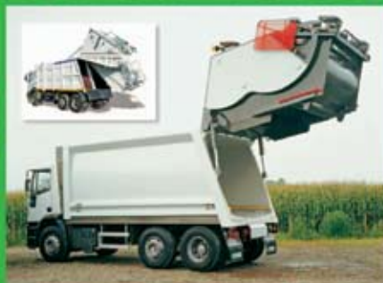
С ЗАДНЕЙ ЗАГРУЗКОЙ (ОПЦИЯ РАЗДЕЛЬНОГО СБОРА МУСОРА)