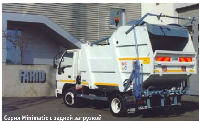
Серия Minimatic с задней загрузкой

двойного действия, что обеспечивает равномерную скорость ее движения, простоту при демонтаже и техническом обслуживании, дает оптимальное использование пространства внутри кузова и большую полезную вместимость.